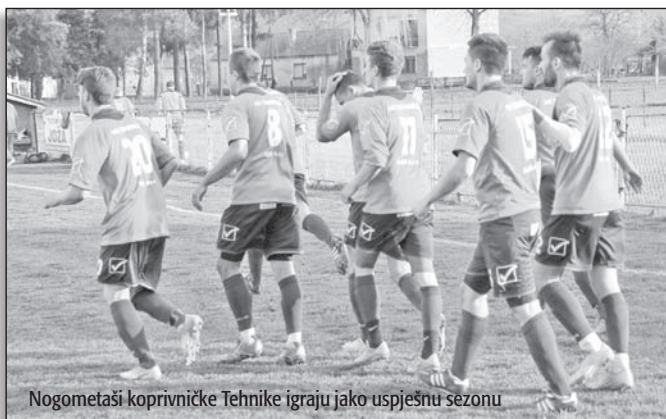
Nogometaši koprivničke Tehnike igraju jako uspješnu sezonu

U prvih pet proljetnih utakmica građevinari su upisali tri pobjede, poraz i remi. Moglo je bolje, ali nije nimalo loše. Dapače, utrka za naslov prvaka i plasman u samom vrhu prvenstvene ljestvice s Tomislavom iz Drnja i Ferdinandovcem vodit će se do samog kraja sezone.