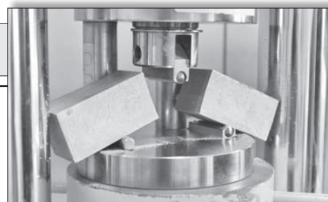
Ispitivanje tlačne i savojne čvrstoće

pljanje. Ugrađuje se kako je gore navedeno u zemljovlažnom stanju. Zbog zahvaćenog zraka ima i dobra termoizolacijska svojstva. Preporučena je primjena kod izvedbe pločica zbog vlažnih prostora te parketa jer su skloni skupljanju pa je potrebna dobra čvrstoća da ne dode do kidanja.