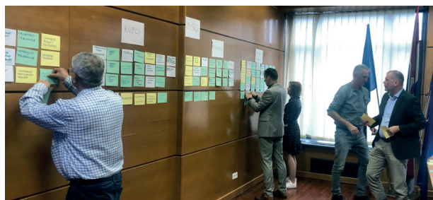
Određivanje i međusobno povezivanje različitih korporativnih ciljeva na različitim razinama

Tijekom odvijanja projekta zahtijevano je od menadžmenta iznimno strpljenje, proaktivnost i inovativnost kroz intenziviran angažman oko traženja rješenja za postojeću problematiku kroz dodatno savjetovanje oko poslovanja.