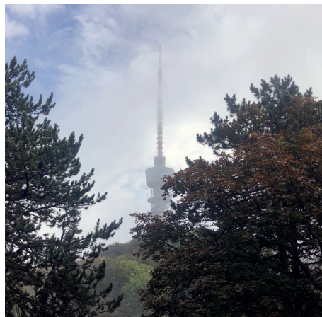
Održavanje višednevnih strateških radionica na izdvojenoj lokaciji na Sljemenu