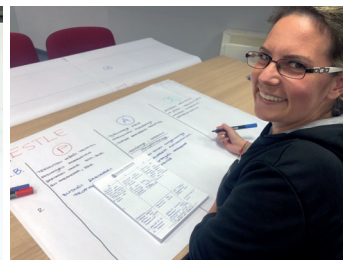
Praktična implementacija konceptualnog strateškog okvira poslovanja

Izlazni rezultati poslovnog savjetovanja, interaktivnih radionica i generirane dokumentacije su iskorišteni kao daljnji poticaj rasta i razvoja uz buduću zajedničku suradnju.