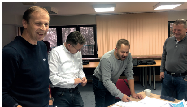
Interaktivno u timu generiranje ideja za korporativne ciljeve

Izlazni rezultati poslovnog savjetovanja, interaktivnih radionica i generirane dokumentacije su iskorišteni kao daljnji poticaj rasta i razvoja uz buduću zajedničku suradnju.